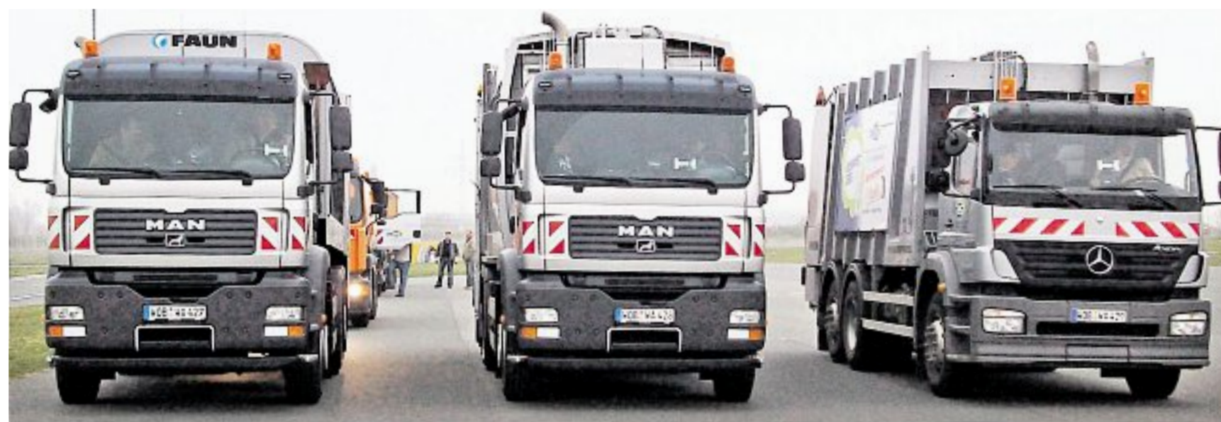
Tross der Müllwagen: Der 400 Meter lange Protestzug führt durch die ganze Stadt (kleines Foto).