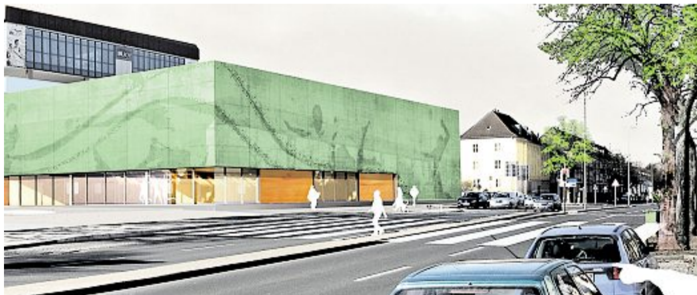
So soll sie aussehen: Die neue Sporthalle entsteht an der Nordseite des Parkhauses CongressPark.