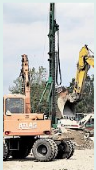
Bau-Software: Das Projekt wird teurer.

Die SAP-Software soll dazu dienen, Bauprojekte der Stadt in den Bereichen Hochbau, Tiefbau, Garten- und Landschaftsbau besser zu steuern und abzuwickeln. Offenbar stellen die beteiligten Geschäftsbereiche