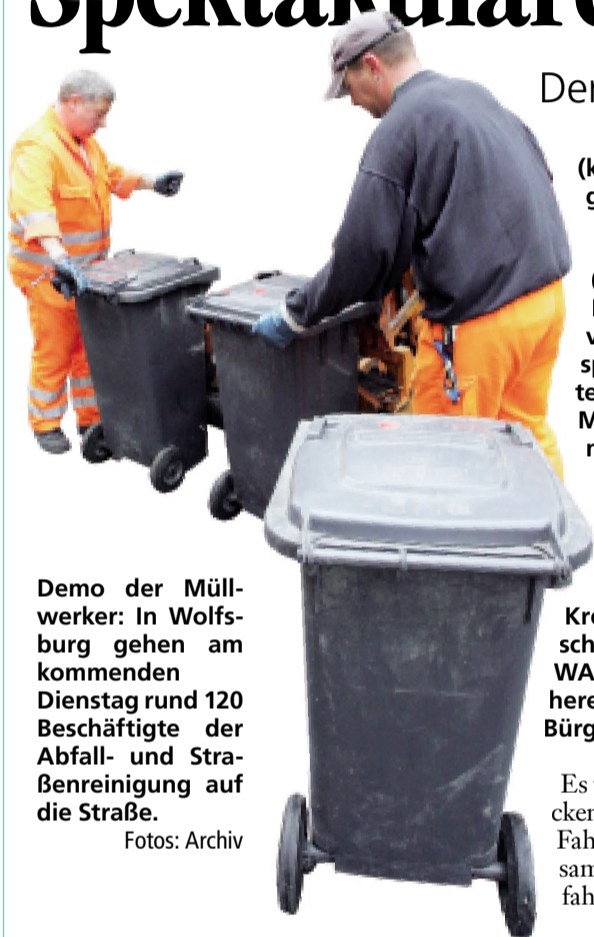
Demo der Müllwerker: In Wolfsburg gehen am kommenden Dienstag rund 120 Beschäftigte der Abfall- und Straßenreinigung auf die Straße.